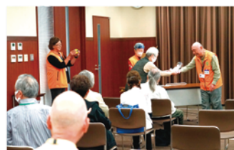
輪投げ対戦 景品授与

最後は3グループに分かれて、ワイワイおしゃべりタイム。自己紹介から始まり、就業や社会奉仕活動のこと、シルバーのサークル活動や趣味のこと、さらには自分の故郷のことなど、船橋ブロック長が閉会を告げるまで、時間が過ぎるのを忘れるほど話がはずみました。新しい仲間と出会え、皆さん、笑顔に満ちた3時間の懇談会でした。