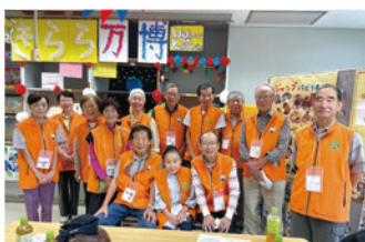
ボランティアの皆さん