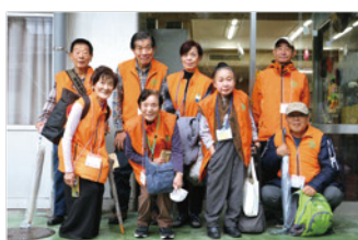
ボランティアの皆さん

イベント会場では和太鼓、ダンス、バンド演奏等があり、色々な商品販売も人気で、来場者は喜んでいました。