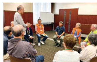
おしゃべりタイム