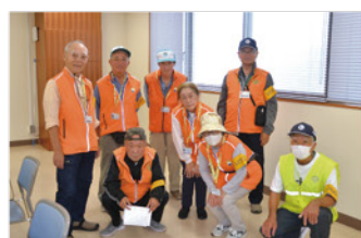
ボランティアの皆さん