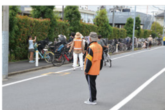
駐輪場・来場者案内

時々雨模様の天気でしたが、地元ならではの海苔つけ体験など多くの出店があり、特に和太鼓・吹奏楽演奏等では大いに盛り上がりしました。