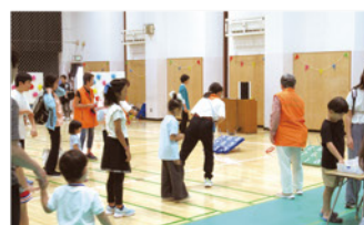
輪投げコーナーを担当(六郷)