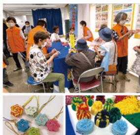
クラフト作成コーナーと作品(萩中)