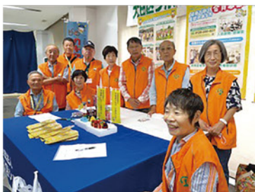
ボランティアの皆さん(萩中)

当センターからはボランティアが参加し、受付や駐輪場案内などの運営補助やコーナーを設けてセンターの紹介等を行いました。