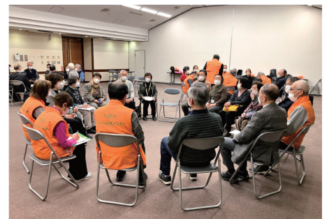
3グループがそれぞれ輪になり懇談