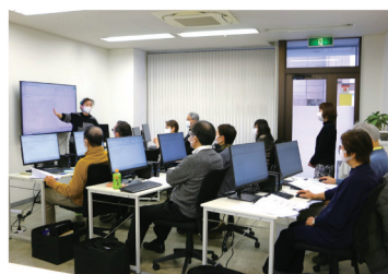
セミナーの受講風景

受講者からは、「やっとパソコンセミナーに参加出来てよかった」、「Excelは使っていますが、関数や機能の利用方法が学べてよかった」、「先生の説明が解りやすく、色々できたので楽しめた」などの声が聞かれました。