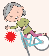
適正・安全委員会