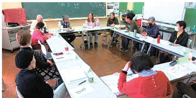
初級アドバンスコースの受講風景

次回は5月の開催予定です。初級・中級どちらでも、興味のある方は、是非お申込みください。