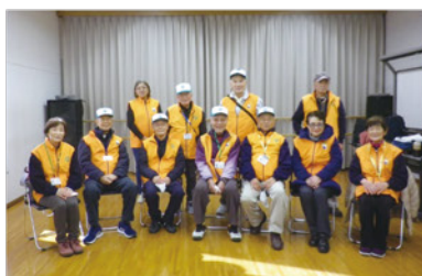
休憩所でのボランティアの皆さん

会員16人が駐輪場と会場の整理にあたり、区民が自転車で新鮮な野菜を求めて来場するので、駐輪場は大忙しでした。地域住民との交流の場ができ大盛況でした。