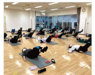
ダンベルやボールを上手に使い良い汗をかきました