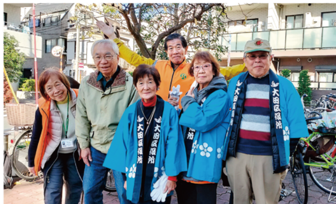
駐輪場整理の皆さん