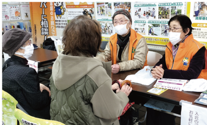
シルバー紹介コーナー

紹介コーナーでは、入会説明や就業などの案内に加え、シルバーサロンの紹介も行いました。