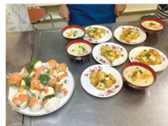
出来上がった料理