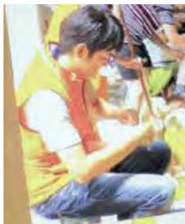
令和元年の池上まつりにて

また、昨年度はホームページのリニューアルにも携わりました。新しいホームページではセンターのPRキャラクター「シルにゃん」がいたるところに登場しています。皆さまも「シルにゃん」を探してみてください。